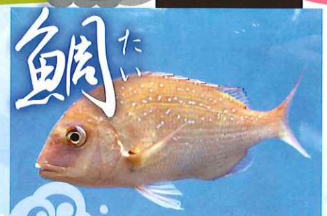
「海釣りの王道」 海老で鯛を釣る!?