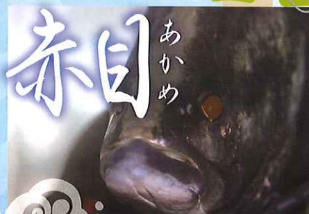
「幻の怪魚」 赤い目をもつ神秘の魚