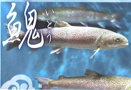
「日本最大の淡水魚」 北の大地にすむ幻の魚