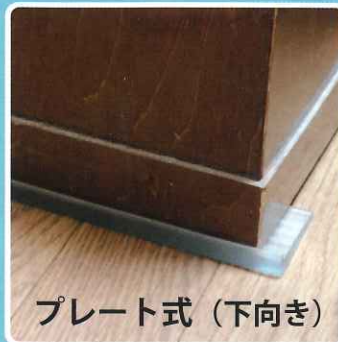
プレート式 (下向き)