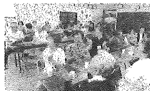
高齢者サロンへの支援