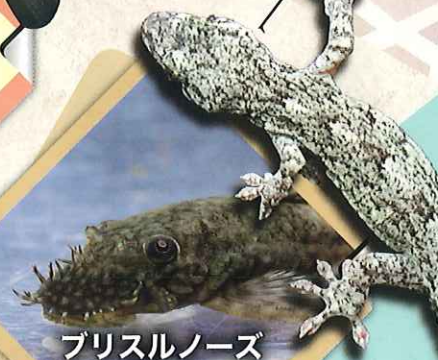
ブリスルノーズ ブレコ