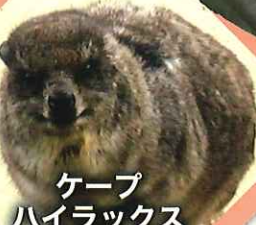
ケープ ハイラックス