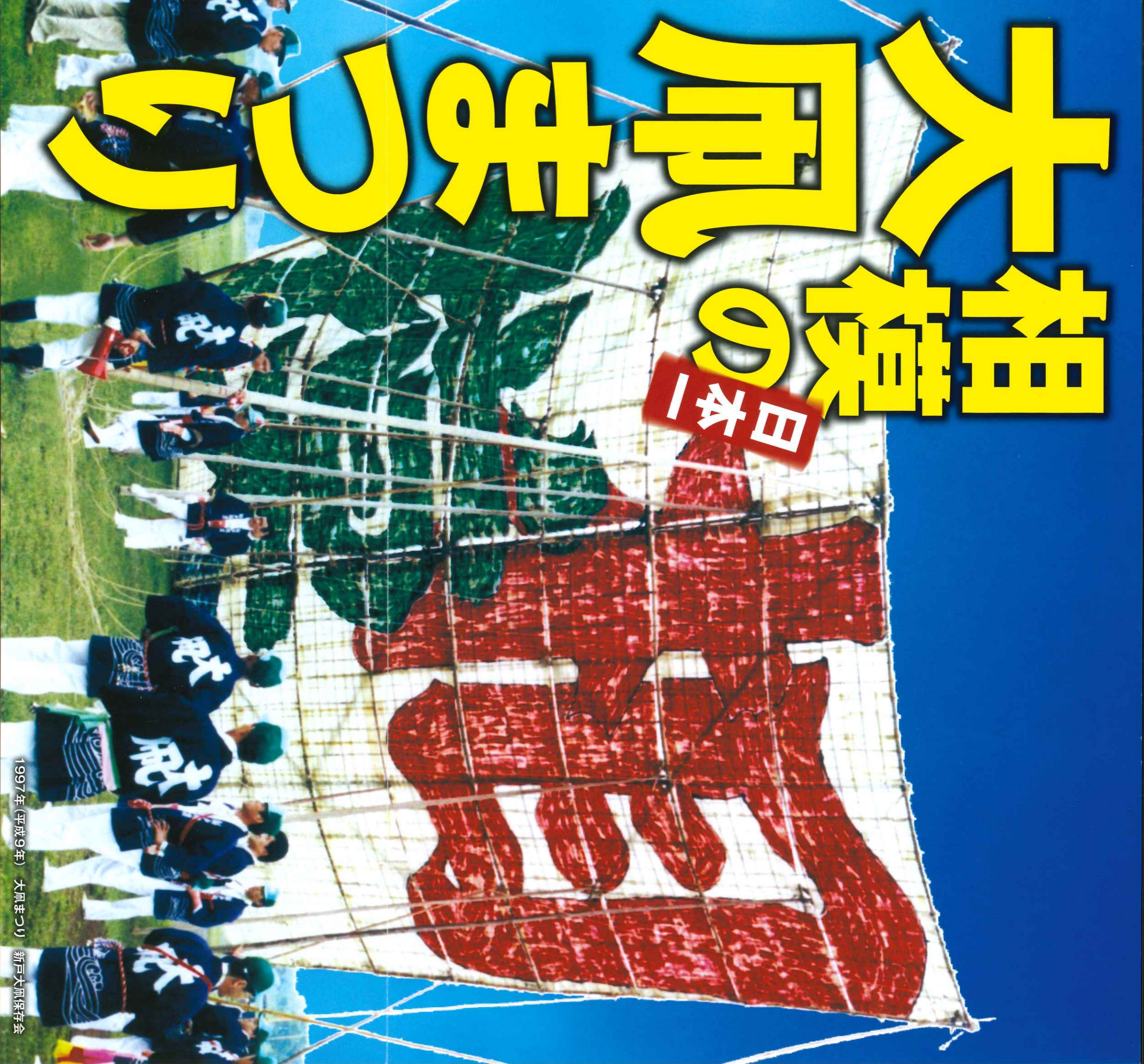
1997年(平成9年) 大風まつり 新戸大風保存会