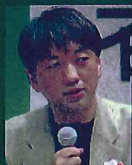
パネリスト 東京都立大学教授 宮台 真司