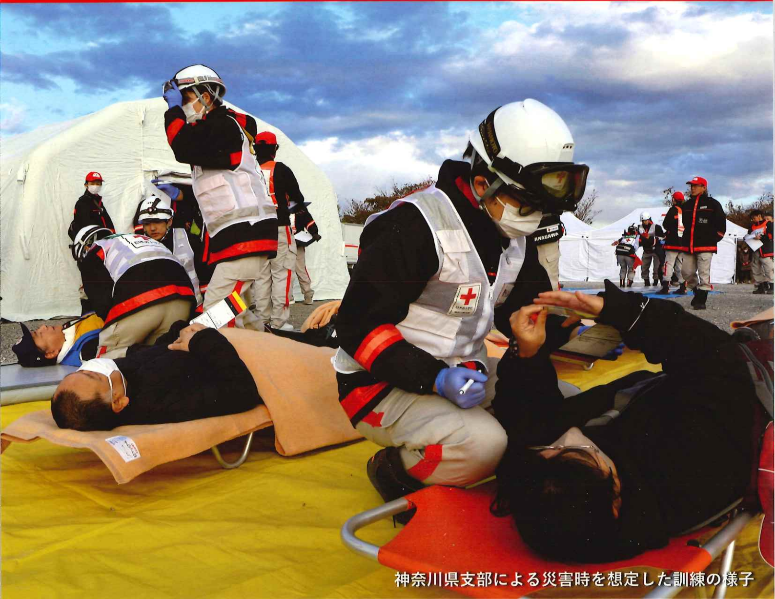
神奈川県支部による災害時を想定した訓練の様子